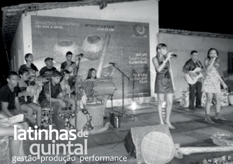
latinhas de quintal gestão produção performance