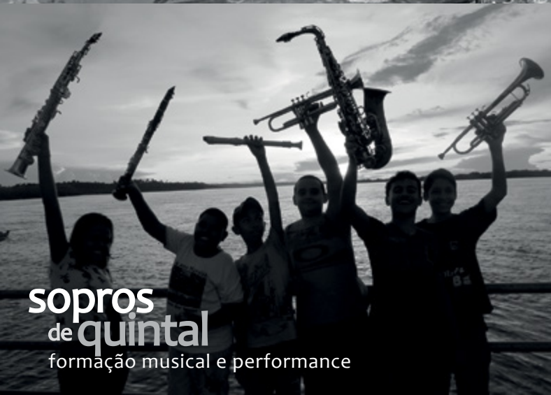
sopros de quintal formação musical e performance