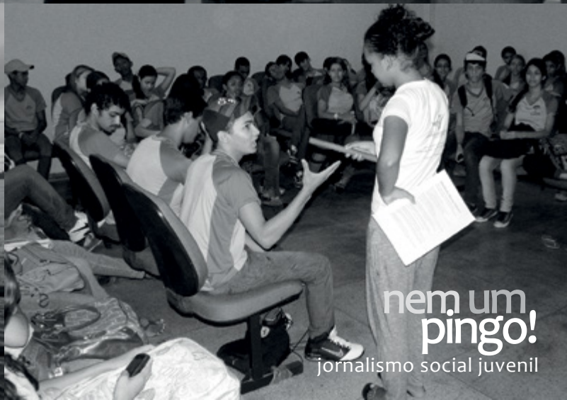
nem um pingo! jornalismo social juvenil