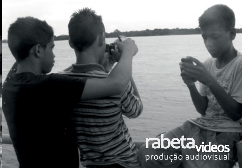
rabeta videos produção audiovisual